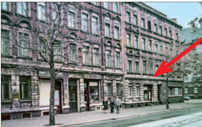
Die Wittenberger Straße 28 und 26 (von links, früherer Lebensmittel-laden: Pfeil), 1975

Senftopf mit Hahn und Pumpe, der Eierdurchleuchter oder der Drehhänger für die Erdal-Schuhcreme-Dosen. Die Butter wurde vom Stück geschnitten und ausgewogen und für das Lampenöl gab es ein Gelass auf dem Hof. Das Gemüse wurde aus der Markthalle geholt. Nach Kriegsende 1945 wurde das Ladengeschäft für kurze Zeit an die bombenbeschädigte Kolonialwarenhandlung Kießel aus