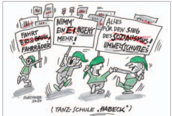
Karikatur von Ulrich Forchner, März 2024