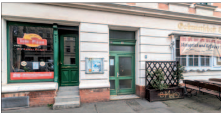
Tele Pizza Wittenberger Straße 26, am 12. März 2024