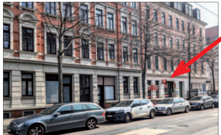
Die Wittenberger Straße 28 und 26 (von links, früherer Lebensmittel-laden: Pfeil), am 31. März 2024